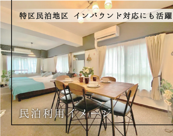
民泊利用イメージ