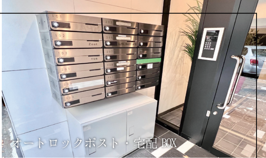
オートロックポスト・宅配BOX